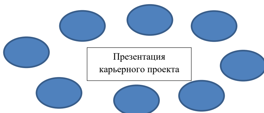
Схема-модель: Возможности при разработке и презентации карьерного проекта

Разработайте схему, которая наведет вас на мысль о вероятных возможностях для подготовки к презентации карьерного проекта. Включите в эту схему темы из учебника, а также другую деятельность или элементы, которые помогут вам в разработке презентации.